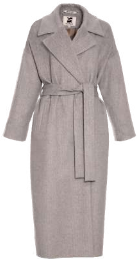
02-CDW0135.0554 601 GREY SIZE XS-S, M-L h 164-176 шерсть 30%, пэ 70%