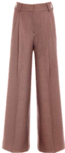
02-TRW0038.1218 804 BROWN SIZE XS-XXXL h 164-176 вис 33%, эл 5%, пэ 62%