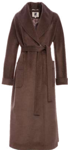
02-CDW0131.1189 804 BROWN SIZE XS-XXL h 164-176 шерсть 50%, вискоза 50%