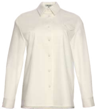
02-BLW0059.1164 101 WHITE SIZE XS-XXXL вис 32%, эл 3%, нэ 65%