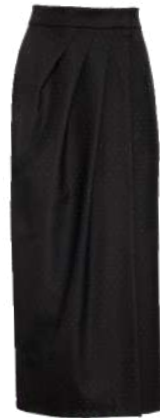
02-SKW0048.1239 901 BLACK SIZE XS-XXL h 164-176 вис 33%, эл 3%, пэ 64%