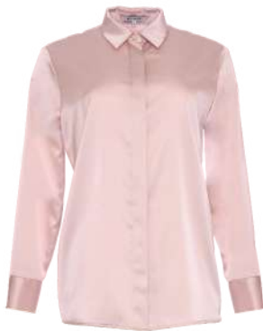
02-BLW0064.1268 404 BEIGE SIZE XS-XXXL спандекс 3%, нэ 97%