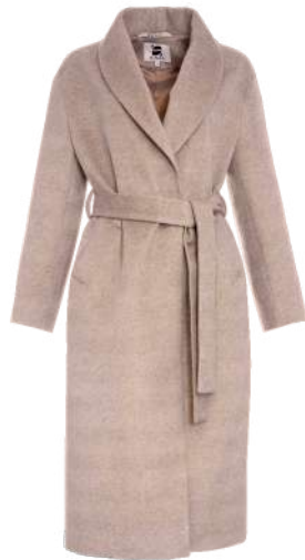
02-CDW0127.1189 601 GREY SIZE XS-XXL h 164-176 шерсть 50%, пз 50%