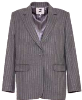
02-JKW0033.1252 801 GREY SIZE XS-XXXL h 164-176 вис 35%, эл 3%, пэ 62%