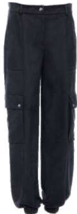
02-TCW0044.1223 810 NAVY SIZE XS-XXL h 164-176 лайкра 4%, пэ 96%