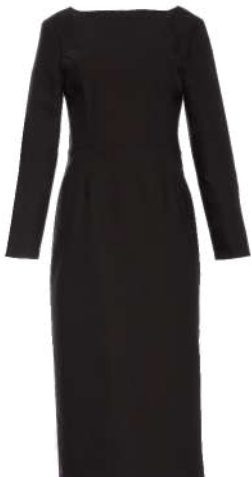
02-DSW0091.1235 901 BLACK SIZE XS-XXL эл 4%, па 41%, хлопок 55%