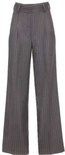
02-TRW0032.1252 801 GREY SIZE XS-XXXL h 164-176 вис 35%, эл 3%, пэ 62%