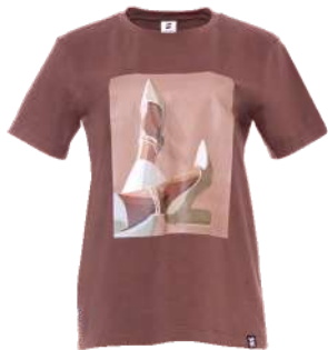
02-THW2073.0575 804 BROWN SIZE XS-XXXL хлопок 92%, лайкра 8%