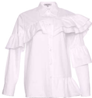
02-BLW0063.1082 101 WHITE SIZE XS-XXL хлопок 100%