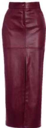
02-SKW0046.1236 605 BURGUNDY SIZE XS-XXL h 164-176 ПЗ 100%