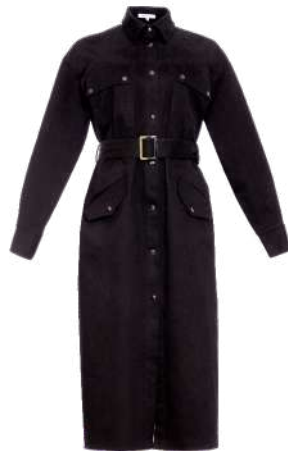
02-DSW00101.1174 901 BLACK SIZE XS-XXXL хлопок 97%, эластан 3%