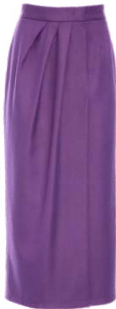
02-SKW0048.0955 809 PURPLE SIZE XS-XXL h 164-176 вис 34%, эл 3%, пэ 63%