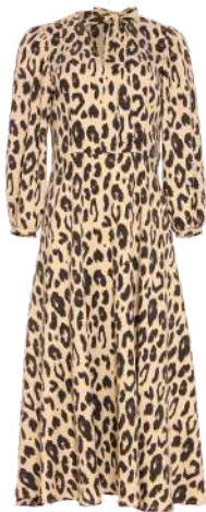
02-DSW0097.1228 404 BEIGE SIZE XS-XXL 100% тенсел