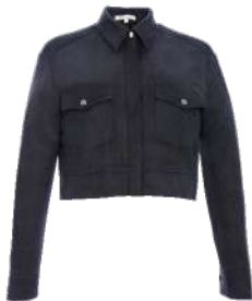
02-SHW0041.1223 810 NAVY SIZE XS-XXL h 164-176 лайкра 4%, пэ 96%