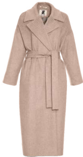
02-CDW0135.0554 105 PINK SIZE XS-S, M-L h 164-176 шерсть 30%, пэ 70%