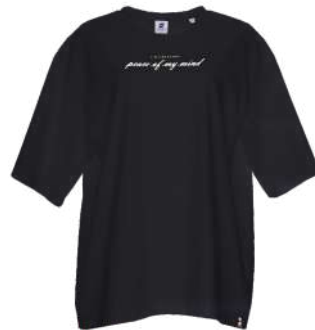
02-THW6076.0596 901 BLACK SIZE XS-S, XS-XXXL хлопок 100%