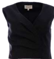
02-VTW0008.1239 901 BLACK SIZE XS-XXL h 164-176 вис 33%, эл 3%, пэ 64%