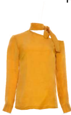
02-BLW0060.1206 202 YELLOW SIZE XS-XXL вис 40%, купро 60%