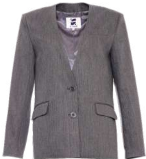
02-JKW0048.1251 801 GREY SIZE XS-XXXL h 164-176 вис 23%, эл 3%, пэ 74%