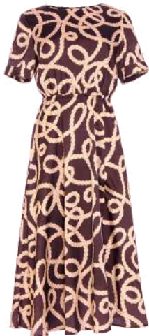
02-DSW0095.1226 804 BROWN SIZE XS-XXL 100% полиэстер