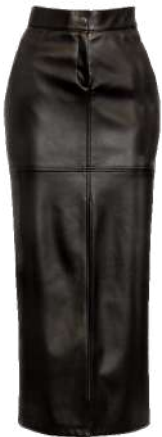
02-SKW0046.1209 901 BLACK SIZE XS-XXL h 164-176 ПЗ 100%