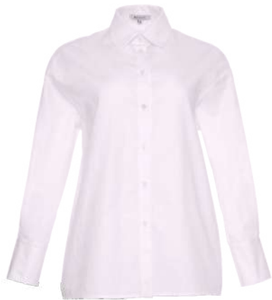
02-BLW0066.1082 101 WHITE SIZE XS-XXXL h 164-176 хлопок 100%