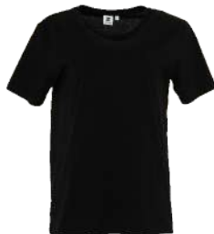
02-THW2000.0596 901 BLACK SIZE XS-XXXL хлопок 100%