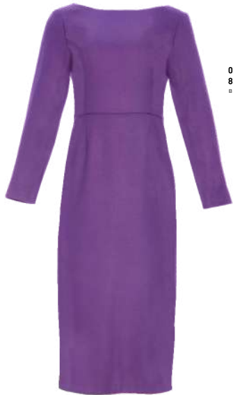
02-DSW0091.0955 809 PURPLE SIZE XS-XXL вис 34%, эл 3%, нэ 63%