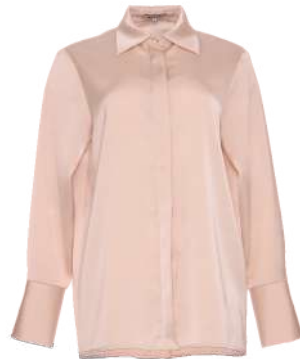
02-BLW0065.1153 404 BEIGE SIZE XS-XXXL эл 5%, нэ 95%