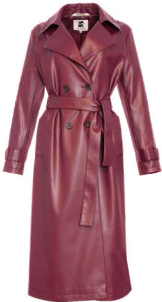
02-RCW00013.1236 605 BURGUNDY SIZE XS-XXL h 164-176 rз 100%