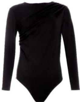
02-BLW0062.1222 901 BLACK SIZE XS-XXL вискоза 48%, лайкра 5%, пэ 47%