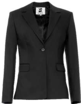
02-JKW0027.1251 901 BLACK SIZE XS-XXXL h 164-176 вис 23%, эл 3%, пэ 74%