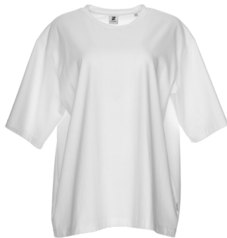
02-THW6000.0575 101 WHITE SIZE XS-XXXL хлопок 92%, лайкра 8%