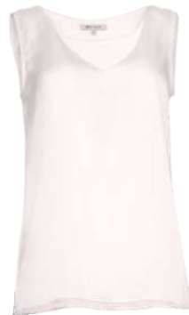
02-TPW0011.1268 101 WHITE SIZE XS-XXXL спандекс 3%, пэ 97%