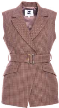
02-VTW0007.1218 804 BROWN SIZE XS-XXXL h 164-176 вис 33%, эл 5%, пэ 62%