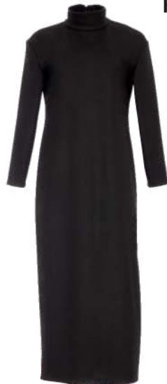
02-DSW0099.1230 901 BLACK SIZE XS-XXXL вис 32%, эл 5%, пэ 63%