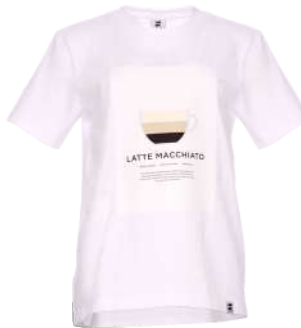
02-THW2074.0575 101 WHITE SIZE XS-XXXL хлопок 92%, лайкра 8%