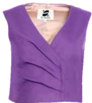
02-VTW0008.0955 809 PURPLE SIZE XS-XXL h 164-176 вис 34%, эл 3%, пэ 63%