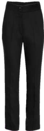
02-TRW0013.1251 901 BLACK SIZE XS-XXXL h 164-176 вис 23%, эл 3%, пэ 74%