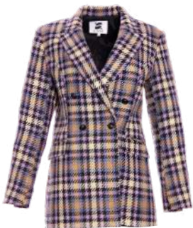
02-JKW0044.1207 809 PURPLE SIZE XS-XXXL h 164-176 вис 8%, эл 25%, ац 55%, хлопок 12%