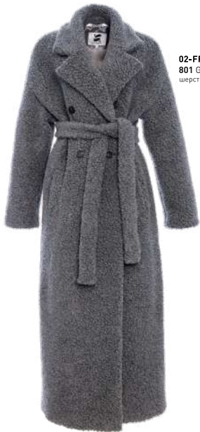
02-FFW00019.0329 801 GREY SIZE XS-S, M-L h 164-176 шерсть 60%, вискоза 40%