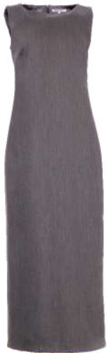
02-DSW0094.1251 801 GREY SIZE XS-XXL h 164-176 вис 23%, эл 3%, пэ 74%