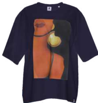
02-THW6075.0596 910 NAVY SIZE XS-S, XS-XXXL хлопок 92%, лайкра 8%