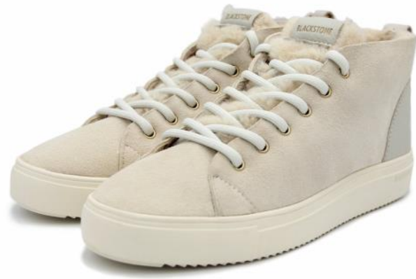
Arnaq QL48 Color: MOON BEAN material: DOUBLE FACE LEATHER Inner material: SHEEPSKIN