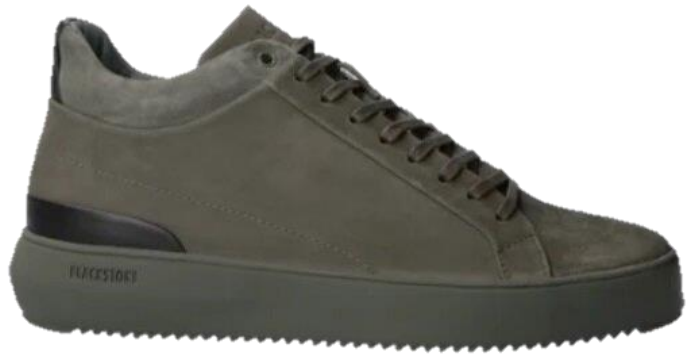
Trevor YG23 color: TARMAC material: NUBUCK Inner material: LEATHER