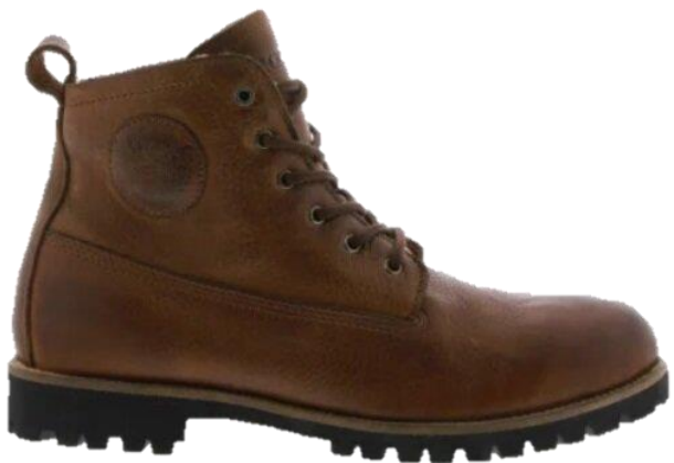
Colin SG31 color: OLD YELLOW material: LEATHER Inner material: SHEEPSKIN INSOLE