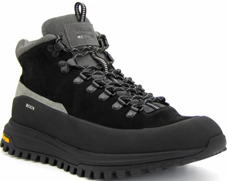
CG 017 color: BLACK material: SUEDE Inner material: MEMBRANE LIVING Sole: VIBRAM