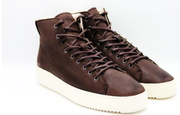
Aspen Dylan YG09 color: PINECONE material: LEATHER Inner material: SHEEPSKIN