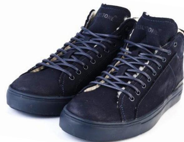
Griffin SG 39 color: NAVY material: NUBUCK Inner material: SHEEPSKIN