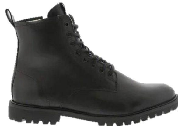
Jaxon SG49 color: BLACK material: LEATHER Inner material: SHEEPSKIN