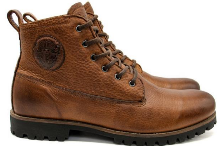
Colin OM 60 color: OLD YELLOW material: LEATHER Inner material: SHEEPSKIN