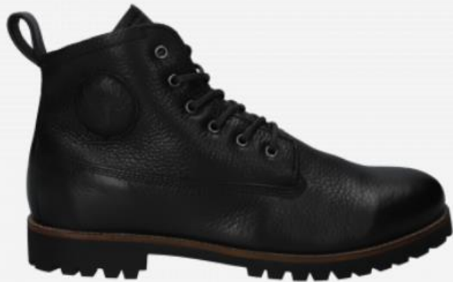
Colin OM 60 color: BLACK material: LEATHER Inner material: SHEEPSKIN