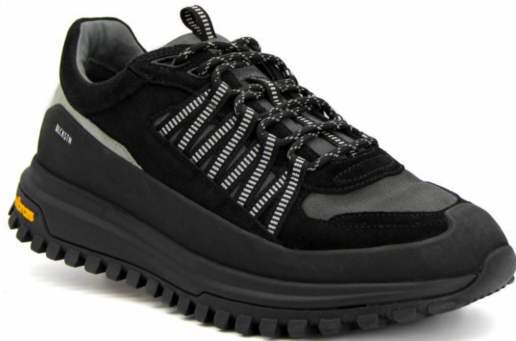
CG 013 color: BLACK material: SUEDE Inner material: MEMBRANE LIVING Sole: VIBRAM