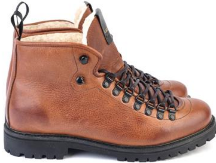
Mountain Wilder UG44 color: OLD YELLOW material: LEATHER Inner material: SHEEPSKIN