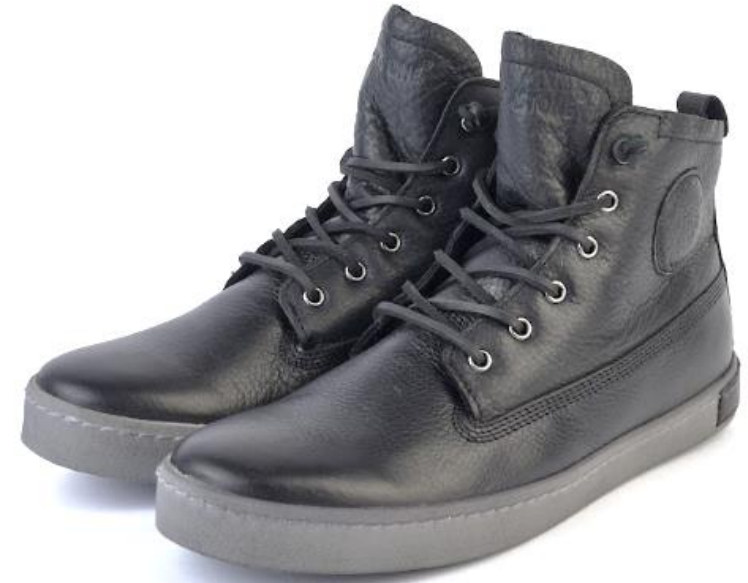
Icon GM06 color: NERO material: LEATHER Inner material SHEEPSKIN