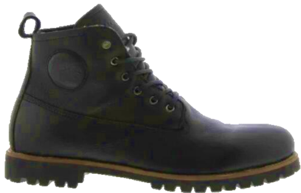
Colin SG31 color: BLACK material: LEATHER Inner material: SHEEPSKIN INSOLE