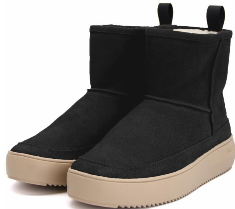
CL 239 Color: BLACK material: SUEDE Inner material: SHEEPSKIN