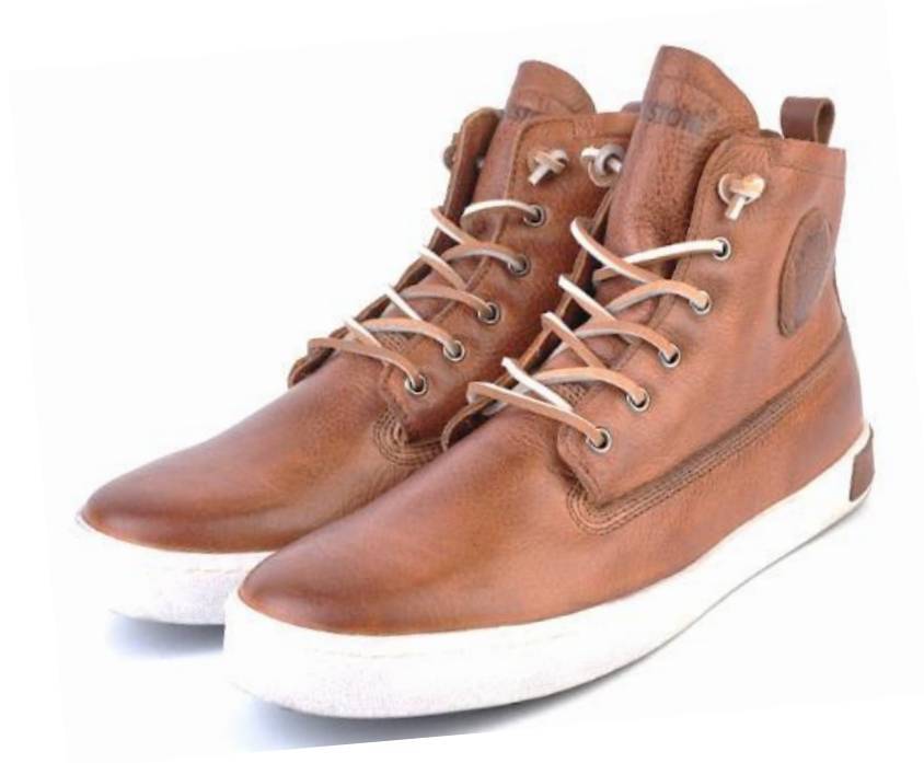
Icon GM06 color: OLD YELLOW material: LEATHER Inner material SHEEPSKIN