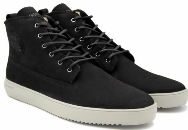
Aspen YG26 color: ASPHALT material: NUBUCK Inner material: SHEEPSKIN