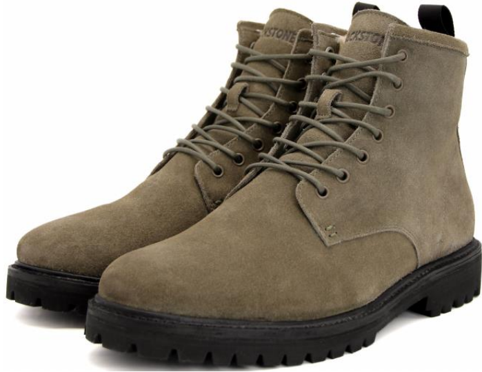
CG 145 color: CANTEEN material: SUEDE Inner material: SHEEPSKIN