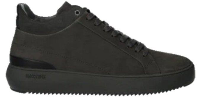
Trevor YG23 color: THANDERSTORM material: NUBUCK Inner material: LEATHER