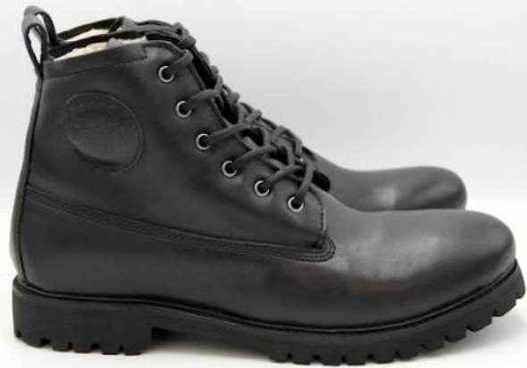
Colin OM 60 color: NERO material: LEATHER Inner material: SHEEPSKIN