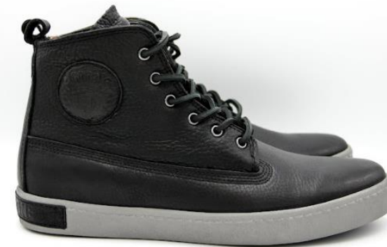
Icon AM02 color: NERO material: LEATHER Inner material: LEATHER