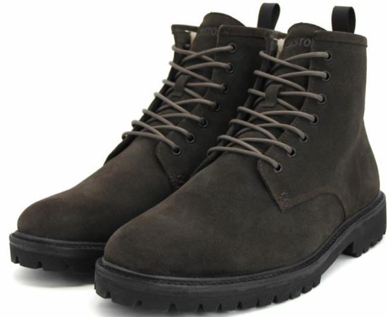
CG 145 color: COFFEE material: SUEDE Inner material: SHEEPSKIN