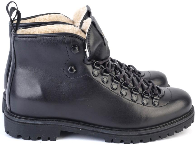
Mountain Wilder UG44 color: BLACK material: LEATHER Inner material: SHEEPSKIN