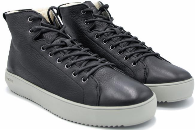
Aspen Dylan YG09 color: BLACK GRAY material: LEATHER Inner material: SHEEPSKIN