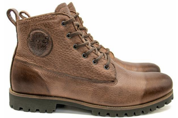
Colin OM 60 color: ANTIQUE BROWN material: LEATHER Inner material: SHEEPSKIN