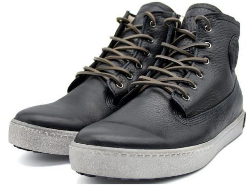
Icon GM06 color: DARK INDIGO material: LEATHER Inner material SHEEPSKIN