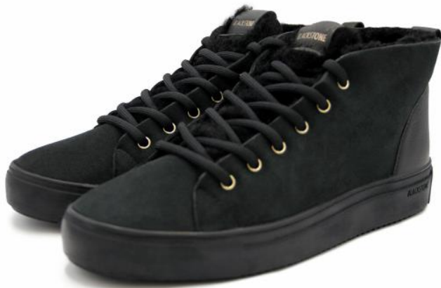
Arnaq QL48 Color: NERO material: DOUBLE FACE LEATHER Inner material: SHEEPSKIN