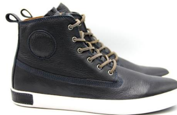
Icon AM02 color: DARK INDIGO material: LEATHER Inner material: LEATHER