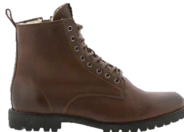
Jaxon SG49 color: OLD YELLOW material: LEATHER Inner material: SHEEPSKIN