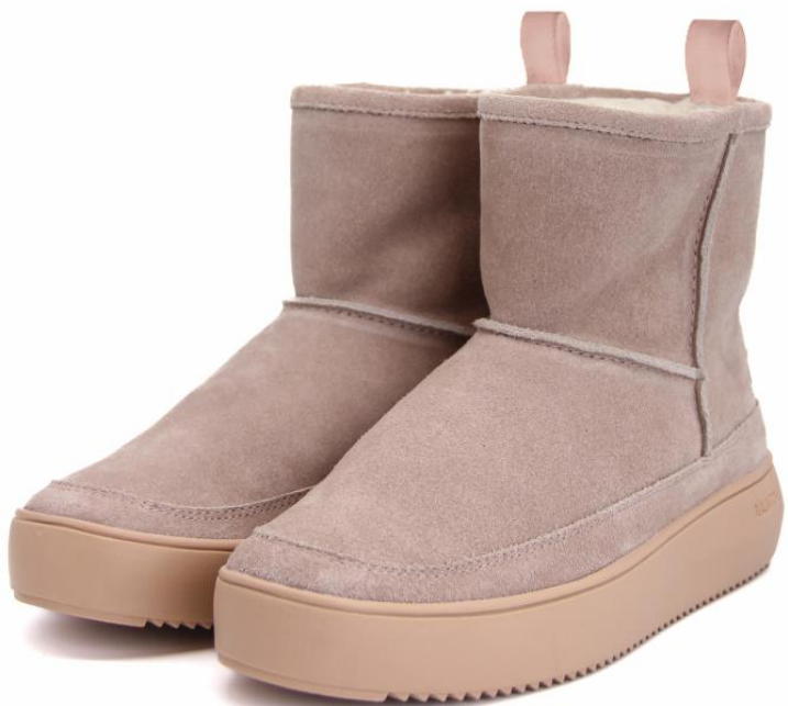
CL 239 Color: WARM TAUPE material: SUEDE Inner material: SHEEPSKIN