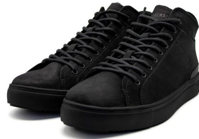
Griffin SG 39 color: BLACK material: NUBUCK Inner material: SHEEPSKIN