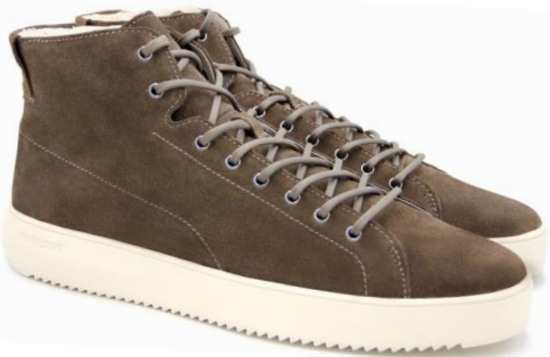
Aspen Dylan YG20 color: SALOON material: SUEDE Inner material: SHEEPSKIN