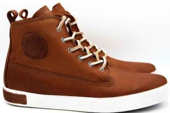
Icon AM02 color: OLD YELLOW material: LEATHER Inner material: LEATHER