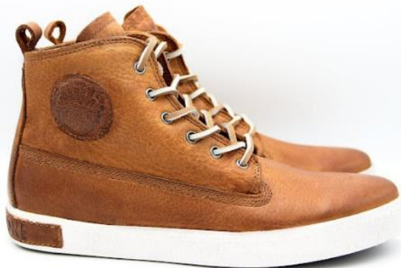
Icon AM02 color: CUOIO material: LEATHER Inner material: LEATHER