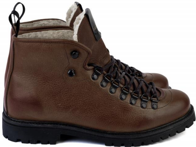
Mountain Wilder UG44 color: PINECONE material: LEATHER Inner material: SHEEPSKIN