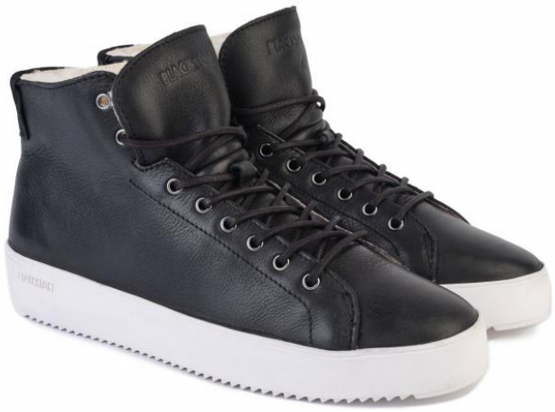
Aspen Dylan YG09 color: BLACK material: LEATHER Inner material: SHEEPSKIN