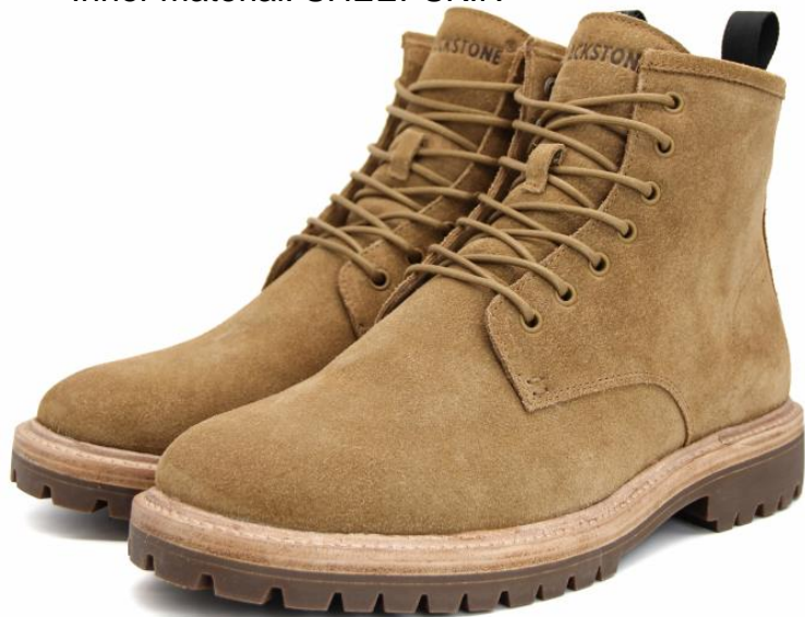
CG 145 Color: DIJON material: SUEDE Inner material: SHEEPSKIN